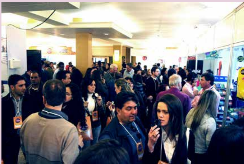
Visitantes lotaram os corredores da edição deste ano

para os organizadores, obtida em pesquisa posterior ao evento, é a de que 97% das pessoas classificaram a feira com muito bom e bom. Martiningui ainda mostrou outros dados obtidos na quarta edição da Expo