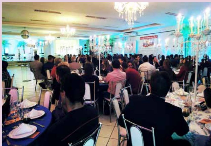
Em Preto & Branco arrancou gargalhadas da plateia