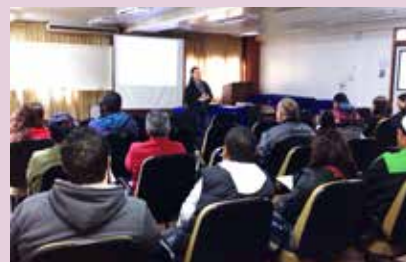
Funcionários receberam instruções práticas e teóricas

esse tipo específico de curso. Os certificados serão emitidos e encaminhados diretamente pela empresa responsável pelo treinamento: Geoemergências.