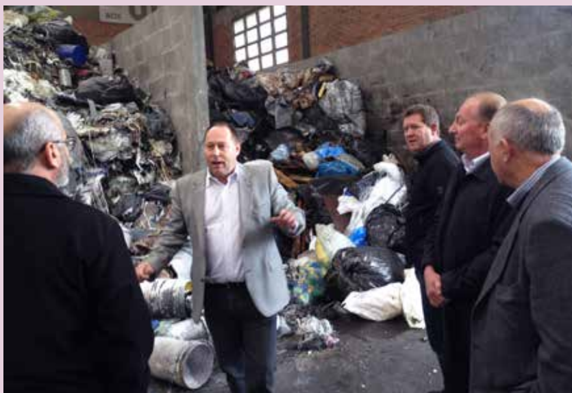
Renova iniciou operações em fevereiro deste ano

toneladas por mês de resíduos sólidos e pastosos.