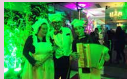
Grupo fez a recepção

Além deles, os organizadores do evento contrataram um grupo de atores do Tem Gente