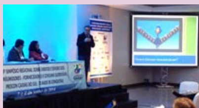
Sindipetro apoia e participa de Seminário Regional do Procon