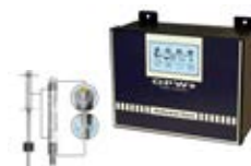
Sistema OPW iTouch de Medição e Monitoramento