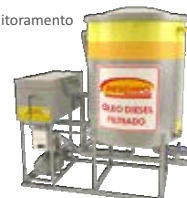
Sistemas de Filtragem