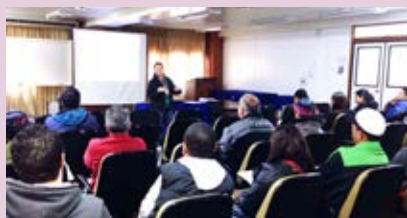
Sindipetro treina mais de 1,4 mil pessoas em oito cidades da região em cursos da NR-20

Confira nestas duas páginas as principais iniciativas realizadas neste ano.