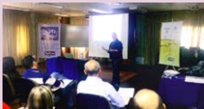
Sindipetro e Enesul realizam workshop para esclarecer dúvidas dos associados sobre a NR-20