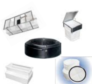
Sistemas OPW de Materiais de Instalação