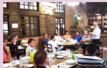
Representantes do sindicato reforçaram informações sobre as novas exigências legais

A outra resolução abordada no encontro foi a de número 50, que, entre outros assuntos, regulamenta o transporte de amostra-testemunha desde a base de distribuição até o posto revendedor varejista. Segundo ela, "deve ser feito na caixa de ferramentas do caminhão-tanque, atendidas as exigências estabelecidas pela legislação da Agência Nacional de Transporte de Terrestres (ANTT). Ao final, os dirigentes do Sindipetro repassaram as principais ações