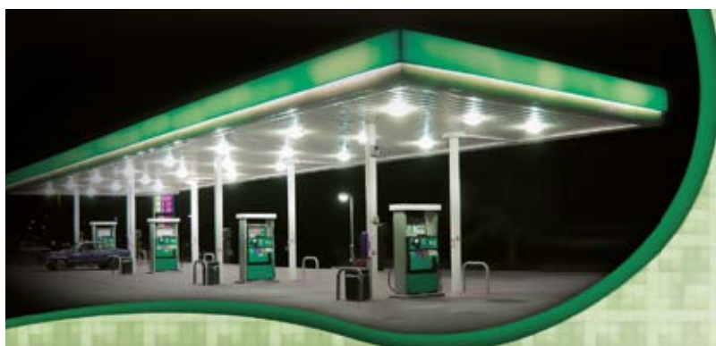
Rua Duque de Caxias, 209, Bairro Americano - Lajeado - RS - Fone 51 3710.5400 ou 54 3222.6663

Nesta edição, o Natal Legal teve a adesão de revendedores de 28 cidades da Serra Gaúcha.