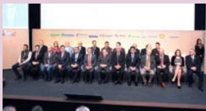
Diretoria e associados conhecem novidades do segmento na Expopetro em Gramado