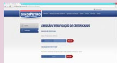
Entidade disponibiliza certificados de cursos online