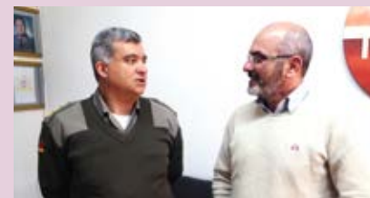
Entidade conversa sobre segurança pública com comando do CRPO e do 12º BPM