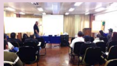
Participantes receberam instruções

Todas essas atividades são exclusivas para postos associados que aderiram ao projeto de implementação da NR-20.