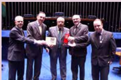
Assessoria do Senador Paulo Paim