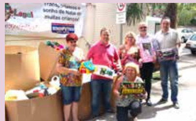
Brinquedos arrecadados em Caxias do Sul foram destinados à FAS

A campanha Natal Legal é organizada pelo Sindipetro desde 2007, tendo como objetivo arrecadar brinquedos nos postos participantes, nos 49 municípios que formam a base da entidade. Ela já distribuiu brinquedos para milhares de crianças em Caxias do Sul e nas demais