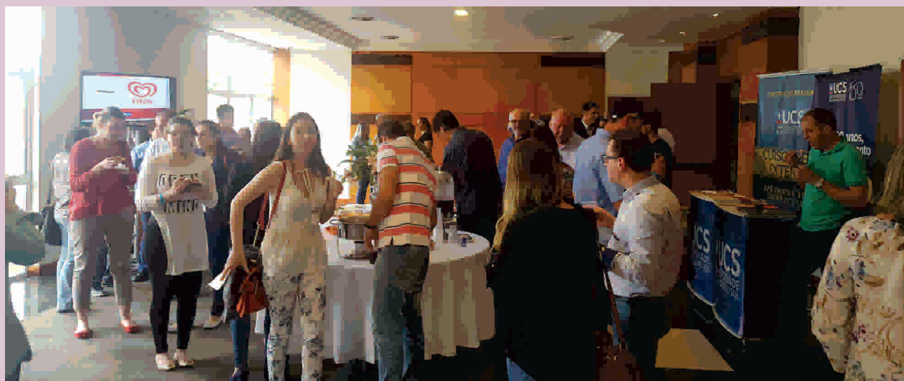
Seminário traz informações para revendedores

Como o seminário ocorre sempre a cada dois anos, a próxima edição está prevista para 2019. Em 2018 é a vez da Expo Conveniências