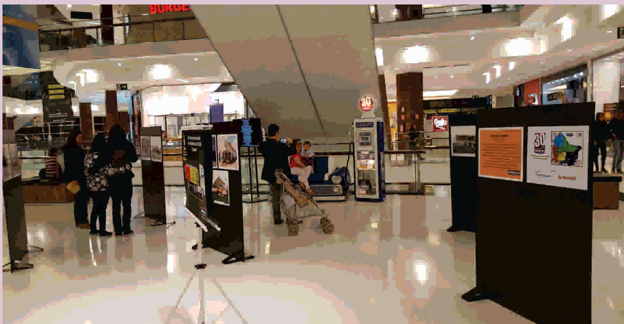
Réplica de um carro e bomba de combustíveis foram algumas das atrações do projeto

A obra, que conta com fotos do primeiro posto de Caxias do Sul e outros tantos da Serra Gaúcha, também chamou a atenção dos visitantes. Ainda foram instalados no shopping uma mostra fotográfica e réplicas de uma bomba de combustíveis e da frente de um veículo. Muitos aproveitaram para fazer uma foto no local.