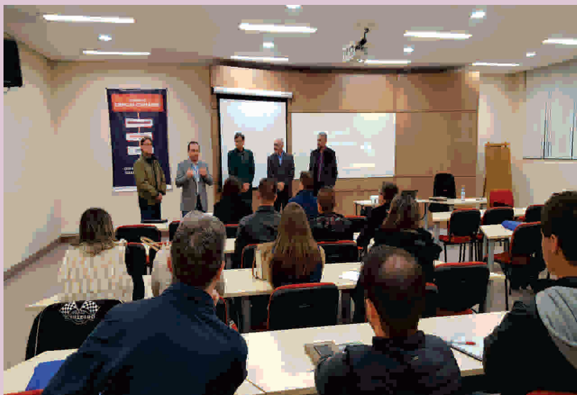
Turma inicial recebeu certificados no início de 2017

Nesta edição foi incorporado mais conteúdo processo de aprendizado, que conta com Gestão de Equipes e Lideranças; Gestão Financeira; Comportamento e Fidelização do Cliente; Gestão de Pessoas; Atendimento ao Cliente e Gestão de Lojas de Conveniência. Além destes seis módulos, a extensão realiza agora um seminário sobre legislação. Nele são abordadas as funções dos poderes (executivo, legislativo e judiciário), normas, resoluções, portarias e leis específicas do setor.