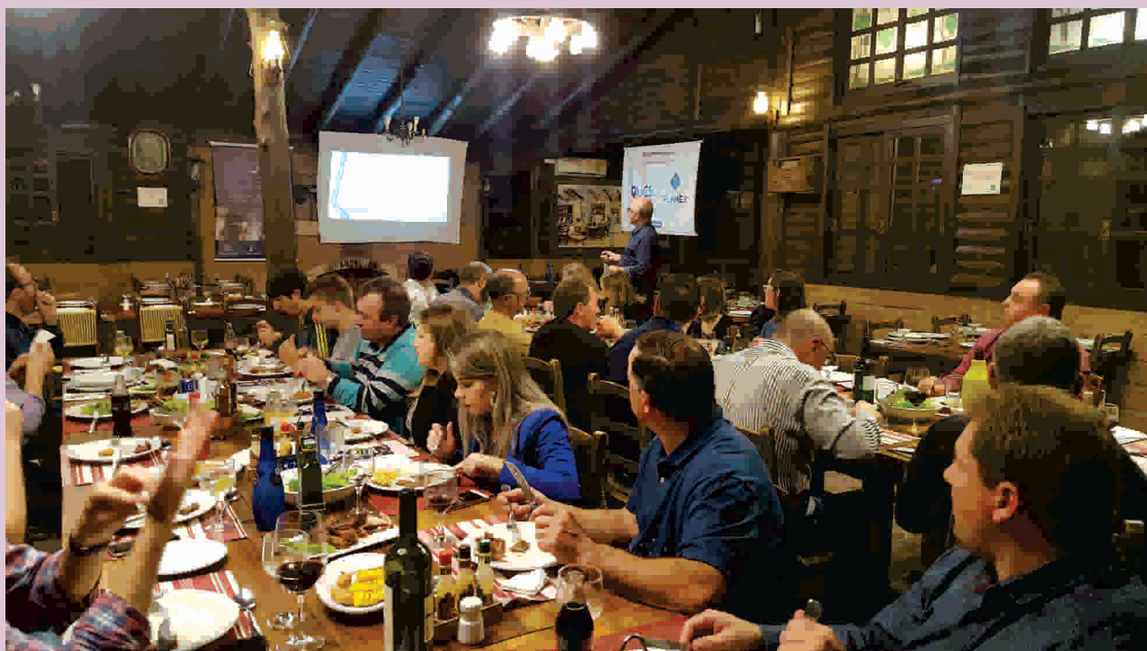
Dúvidas sobre as leis e normas foram tratadas na edição de Bento