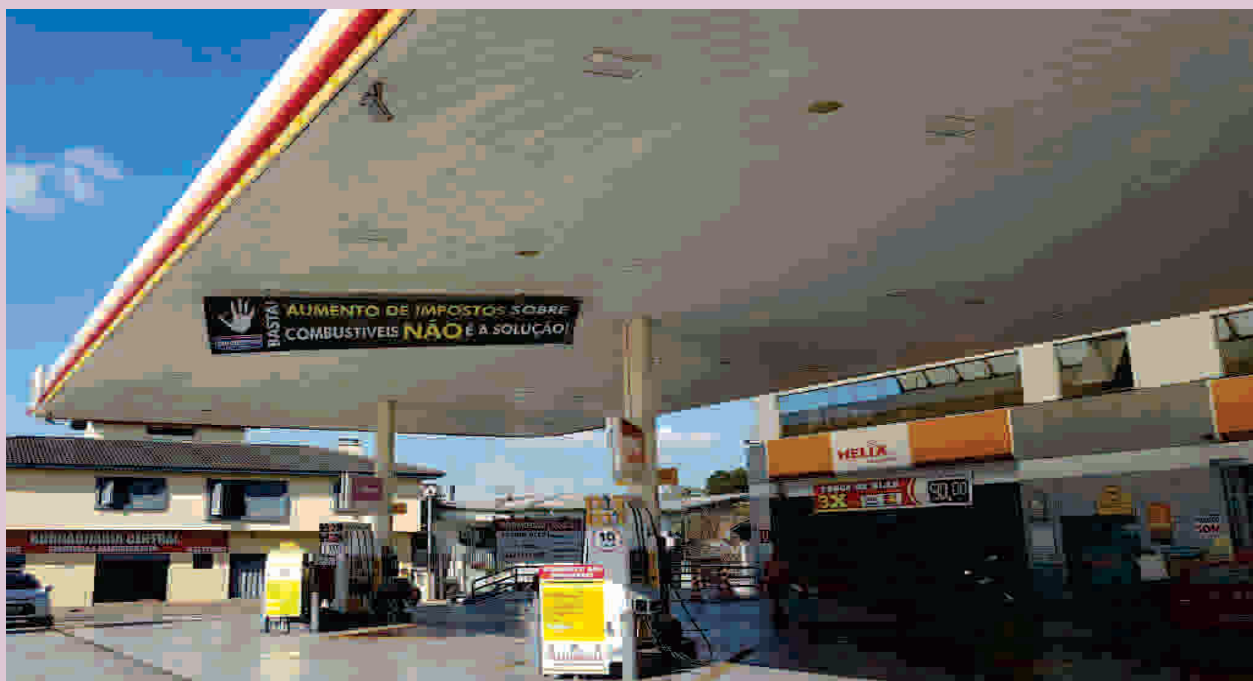
Revendedores colocaram faixas de protesto nos postos da região

Também foram feitos comerciais em rádios e jornais da região. A ação ocorre depois de o governo federal adotar uma prática antiga: aumentar tributos para cobrir um déficit fiscal. No dia 21 de julho deste ano foi divulgada a elevação no percentual de PIS e Cofins sobre a gasolina, diesel e etanol.