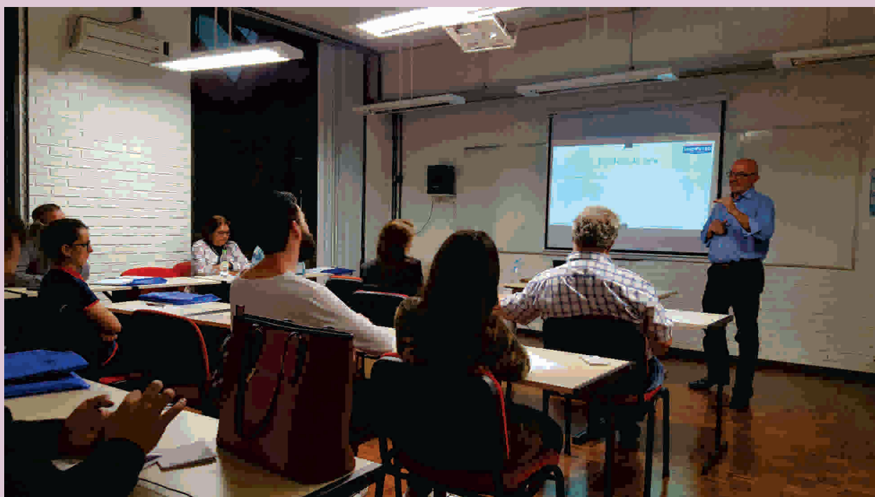
Reedição da extensão teve informações sobre legislação

por passar as informações no seminário, todas as revendas devem ficar atentas a leis que regem o segmento: "São muitas, bastante rígidas e importantíssimas. E devem ser cumpridas", afirmou o presidente do Sindipetro.