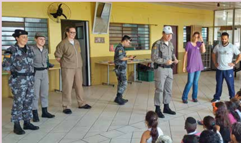
PMs não esconderam a emoção na entrega dos brinquedos

Porém, eles estavam cumprindo uma missão de solidariedade. No dia 21 de dezembro os PMs levaram os brinquedos na Entidade Assistência à Criança e ao Adolescente (Enca) do bairro Belo Horizonte. Logo que chegaram despertaram o