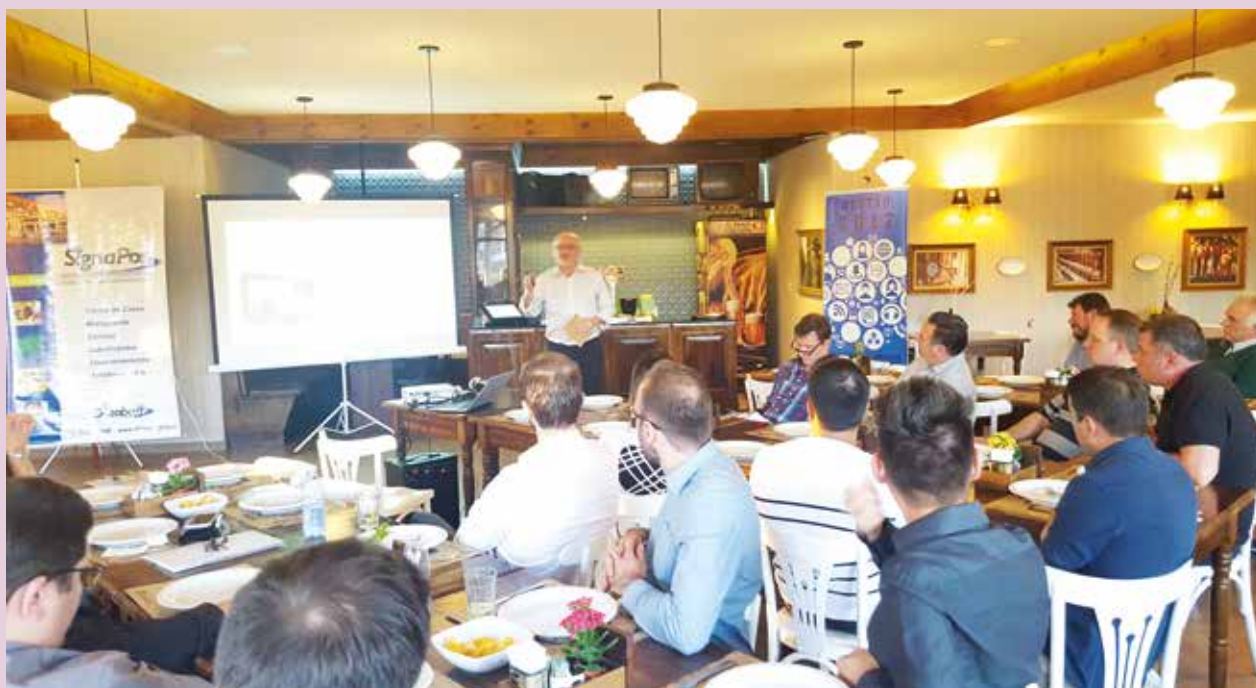
Martiningui falou com revendedores da região de Gramado

Também fazem parte desta região os municípios de Cambará do Sul, Canela, Jaquirana, Linha Nova, Picada Café, São Francisco de Paula e Vale Real.