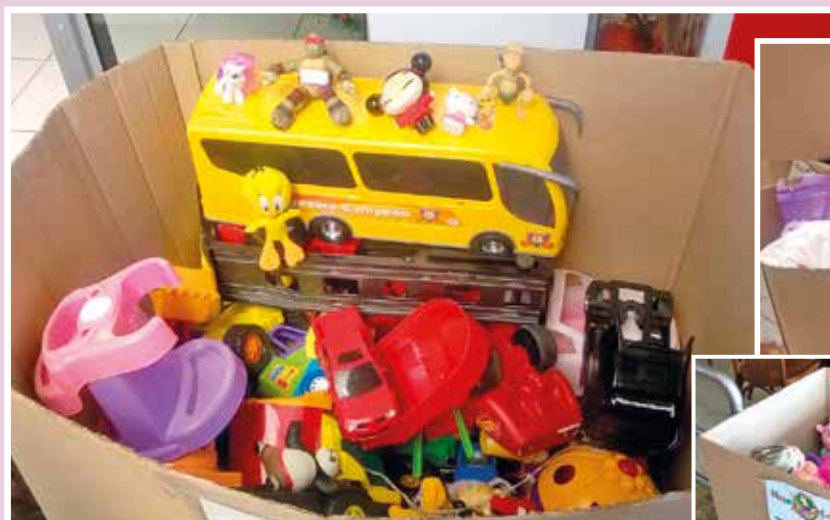
Natal Legal reuniu uma centena de brinquedos em Caxias

Muitos contribuíram para tornar melhor o Natal das crianças de Caxias do Sul e da Serra. Os brinquedos doados em Bento, Farroupilha e Nova Petrópolis foram entregues para entidades assistenciais.