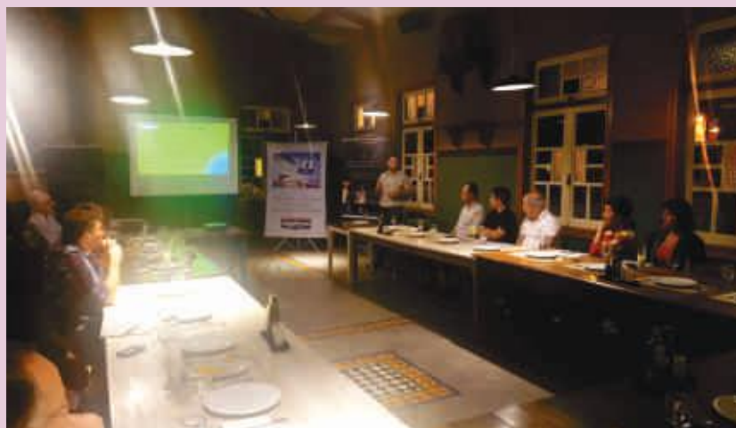
A primeira edição do Sindicato Itinerante ocorreu em Vila Flores

podem entrar em contato pelo telefone (54) 3222.0888 ou pelo e-mail atendimento@sindipetroserra.com.br. A região de Nova Prata compreende André da Rocha, Cotiporã, Fagundes Varela, Guabiju, Nova Araçá, Nova Bassano, Nova Prata, Protásio Alves, Veranópolis, Vila Flores e Vista Alegre do Prata.