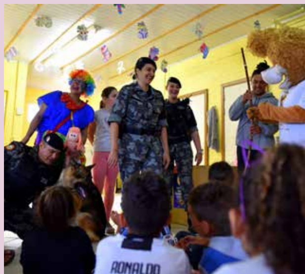
Garotada fez a festa com PMs do 12º BPM

Os brinquedos foram recebidos por eles, talvez, como seus únicos presentes de Natal, mas além disso, a interação com os PMs ficará marcada como um momento especial. A emoção tomou conta do lugar e deixou alegre, também, as pessoas que trabalham no ENCA. Elas observavam as crianças mostrarem, encantadas, os brinquedos que tinham recebido ou dizendo do carinho feito no Conan ou as fotos tiradas com os policiais.