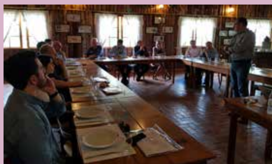
Após a Expo Conveniências, o sindicato promoveu um almoço com os expositores. No encontro, elas foram informadas de todas as ações de promoção e de divulgação realizadas antes da feira. Ou seja, conferiram aonde e como a marca delas foi apresentada.