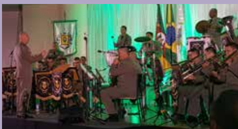
Concerto na sede social do Recreio da Juventude em Caxias do Sul contou com a presença do Sindipetro. A banda da Brigada Militar fez o show em comemoração ao aniversário do 12º BPM.