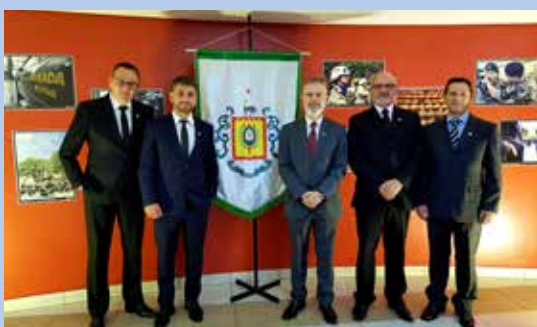
Diretoria do sindicato participou do jantar de aniversário do 12º BPM. Atividade fez parte da intensa programação de ações da corporação, que comemorou 44 anos.