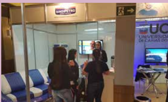
Sindipetro montou estande na Expo Conveniências para atender demandas dos revendedores. Público também teve a oportunidade de degustar produtos e conferir as novidades para lojas de conveniências.