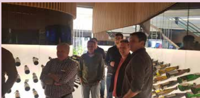
Proprietários de postos conferem atendimento diferenciado na loja de vinhos Mistral em SP