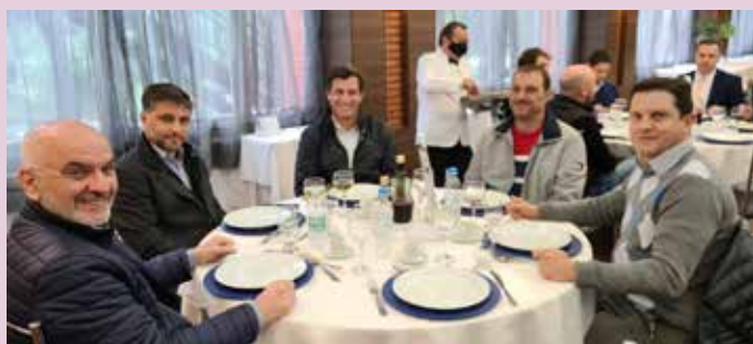
Diretores do Sindipetro acompanham reunião-almoço sobre combustíveis realizada na CIC de Caxias