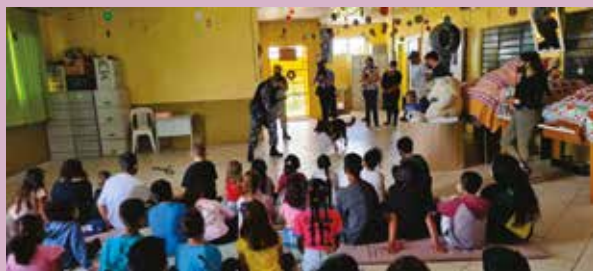
Associados aderem e reúnem muitas doações