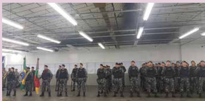
Inauguração do Batalhão de Choque é acompanhada por integrantes da diretoria do Sindipetro