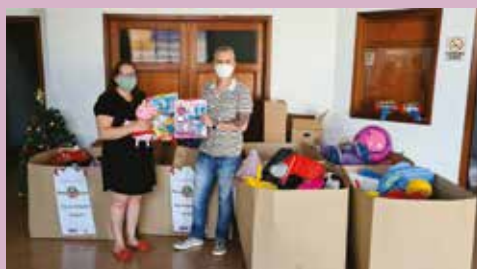
Parte dos brinquedos arrecadados em Caxias do Sul são entregues à LEFAN