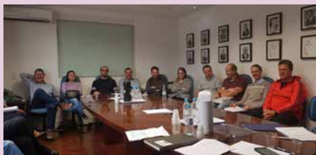
Contadores de vários postos associados e diretores do Sindipetro se encontram para debater ROT ST