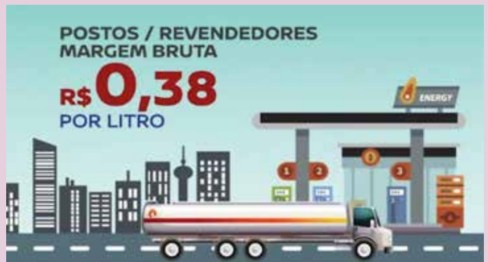
Campanha Mitos e Verdades explica em vídeo como funciona o setor e quanto cada um ganha no processo