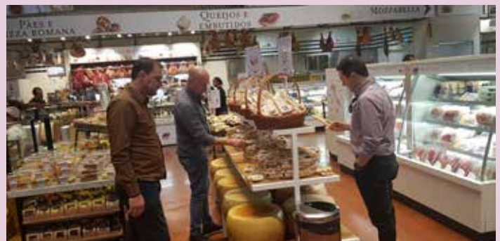
Sindicato leva sócios e parceiros comerciais para conhecer o Eataly, em São Paulo (SP)