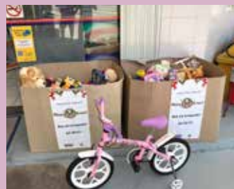
Postos da região integram ação solidária