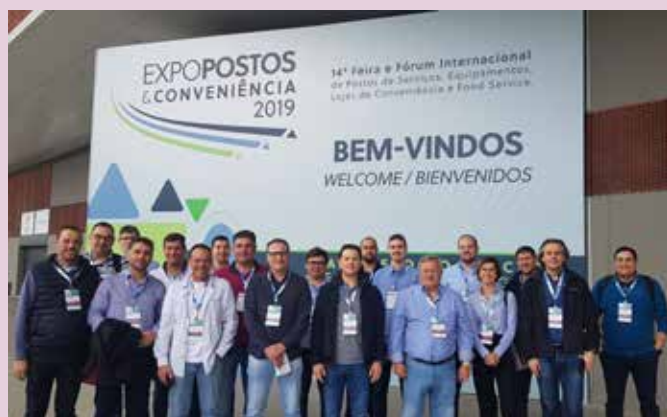
Expopostos: associados participam de visita organizada pelo Sindipetro