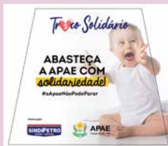
Sindipetro e postos associados promovem campanha para a APAE Caxias