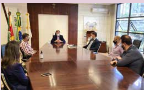
Representantes do sindicato participam de encontro na Prefeitura de Caxias