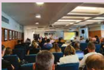
Presidente do Sindipetro representa entidade em diversos eventos da ANP