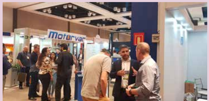
Associados do Sindipetro participam da feira de negócios Expopetro em Porto Alegre