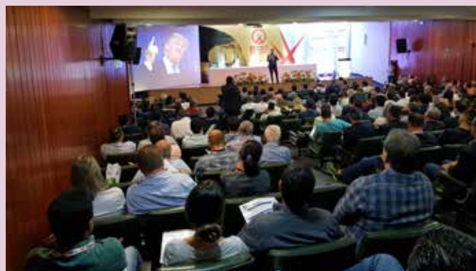
Entidade é representada em feira do segmento realizada em Goiânia (GO)

Diretoria e contadora do Sindipetro percorrem região para explicar questões envolvendo o ROT