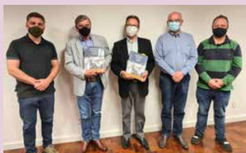
Candidatos a prefeito de Caxias do Sul visitam entidade e mostram propostas