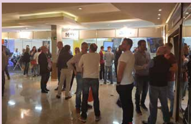
Público confere as novidades de mercado na feira instalada no Samuara Hotel