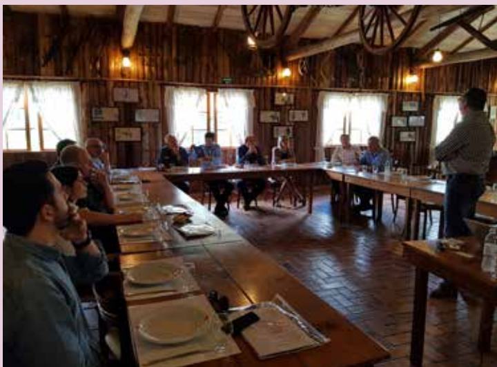
Durante almoço expositores recebem os resultados da Expo Conveniências de 2018