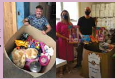
Instituições da Serra recebem vários itens