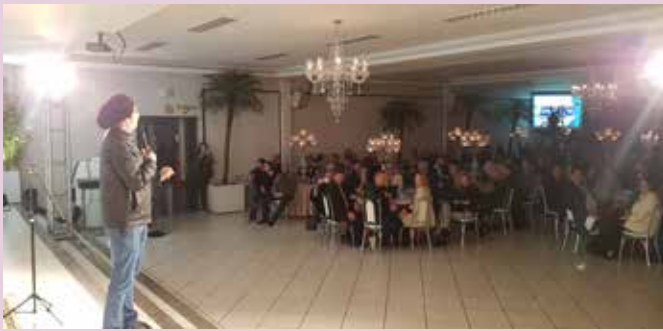
Festa anual do Dia do Revendedor conta com show do humorista Emerson Ceará