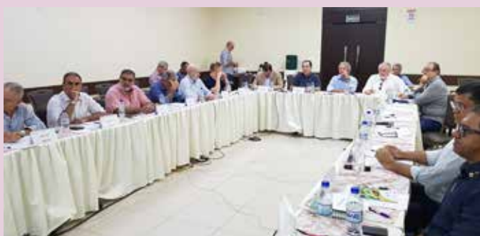
Sindipetro faz parte do Conselho da Fecombustíveis, federação que representa o segmento