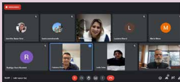
Sindipetro promove live gratuita para associados sobre marketing em postos de combustíveis