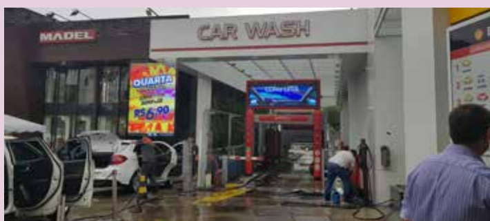
Revendedores visitam postos da capital paulista para comparar realidades, identificar diferenças entre os estabelecimentos