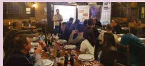
Bento Gonçalves sedia última reunião do Sindicato Itinerante antes do início da pandemia