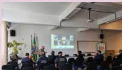
12º BPM lança campanha de segurança em Caxias do Sul e Sindipetro é apoiador