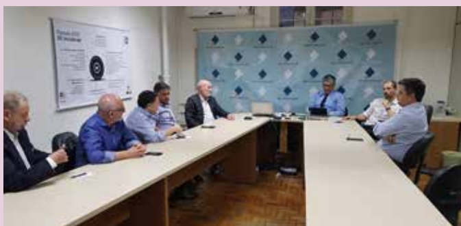
Regime Optativo de Tributação (ROT) é pauta de muitas reuniões entre governo do estado e entidades do setor