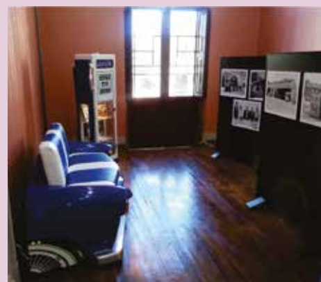
Nova Prata: Projeto Nossa História percorre região de abrangência do sindicato