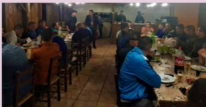
Sindipetro promove jantar de confraternização com integrantes da Brigada Militar (BM)