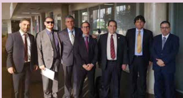
Certificação digital também integra pauta de trabalho em evento realizado no Instituto Serzedello Corrêa do Tribunal de Contas da União.