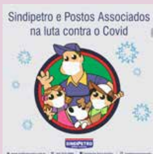
Sindicato faz campanha educativa e informativa de combate ao coronavírus