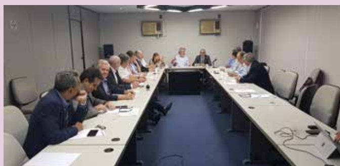
Reunião entre Conselho da Fecombustíveis e integrantes da ANP tem presença do Sindipetro