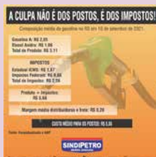
Mais uma vez impostos e aumento nos preços dos combustíveis geram informações erradas e sindicato promove campanha para esclarecer