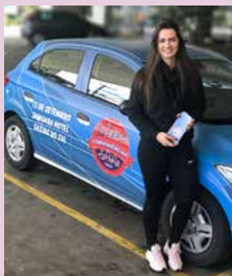
Revendedores recebem material com toda a programação da Expo Conveniências