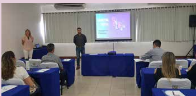
Seminário Conveniências em Tendências oferece treinamento gratuito para associados de revendas.