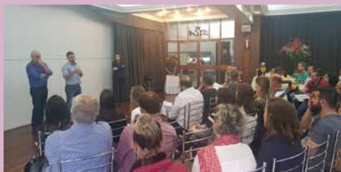
Caxias do Sul