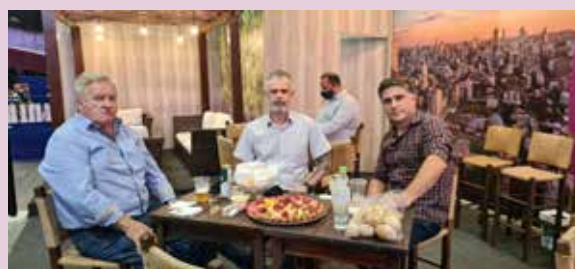
Sindicato e outras entidades montam estande na Festa da Uva