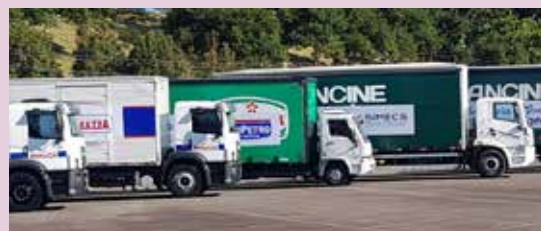
Cestas-básicas são doadas pelo Sindipetro e associados para várias cidades da serra gaúcha