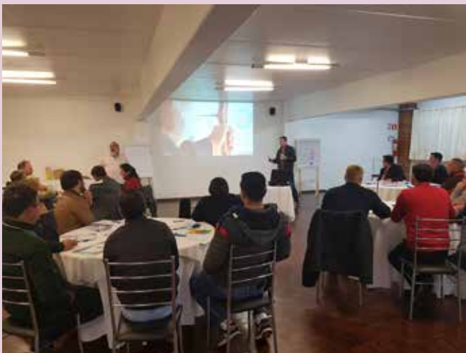
Curso promovido pelo Sindipetro trabalha potencial das equipes dos postos de combustíveis