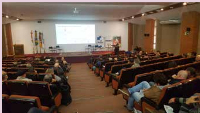
Procon Caxias do Sul e Procon Rio Grande do Sul, com apoio do Ministério Público Estadual e Federal, realizam o painel "O mercado de Combustíveis em Pauta" no auditório da CIC de Caxias do Sul

Governo federal publica a Portaria 760, de 5 de junho de 2018, obrigando os postos a afixarem cartaz com valor de redução no preço do diesel ao consumidor final. O Sindipetro encaminha modelo de cartaz a todos os associados e orienta que tenham à disposição também as notas de compra em caso de fiscalização dos órgãos competentes.