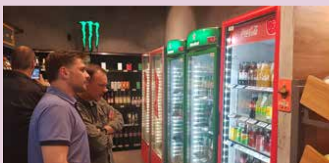
Grupo de empresários passa também pela Zaitt, loja sem atendentes, no bairro Berrini, em SP, para conhecer sistema inovador