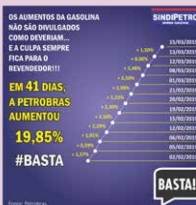
Campanha elaborada pela entidade mostra sucessivos reajustes da Petrobras