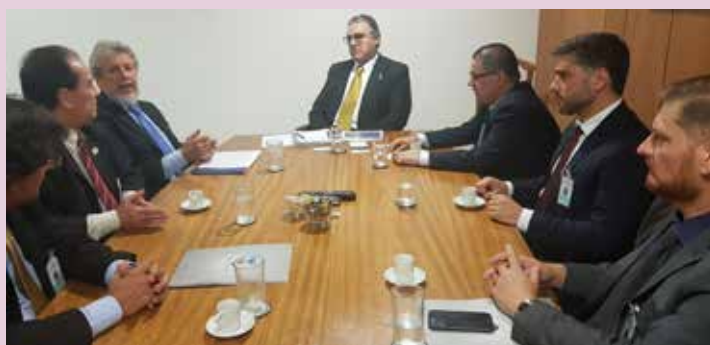
Última reunião na capital do país inicia às 18h, no Palácio do Planalto, para tratar de demandas dos postos de combustíveis