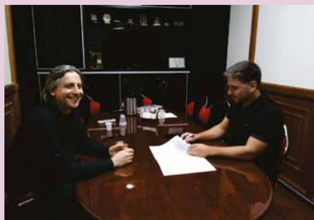
Databoff (foto), Geoambiental e JS – Engenharia firmam parceria com Sindipetro