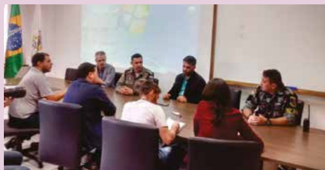
Sindipetro, comandos do CRPO Serra e do 12º BPM atuam em conjunto para não ocorrer desabastecimento na região