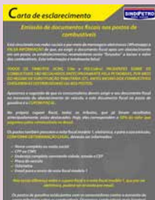
Entidade elabora campanha para esclarecer e combater notícias falsas