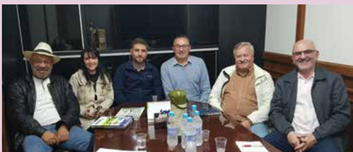
Negociação da Convenção Coletiva com sindicato laboral ocorre na sede do Sindipetro