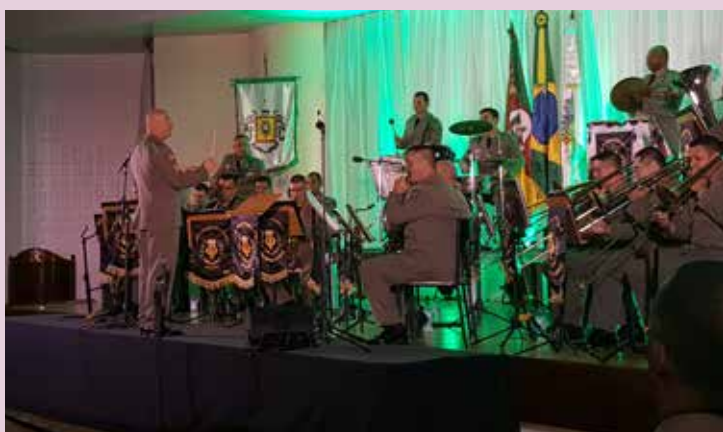
Entidade participa de concerto em comemoração ao aniversário da Brigada Militar (BM)