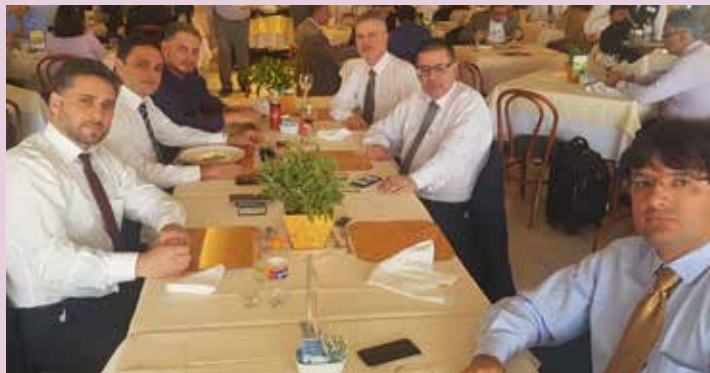
Representantes do Sindipetro almoçam com diretor-presidente do Instituto Nacional de Tecnologia da Informação, Marcelo Buz.