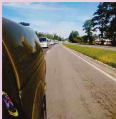
Comboios de caminhões-tanque com escolta da BM garantem combustível para a Serra

Por que parar no tempo quando você pode evoluir?