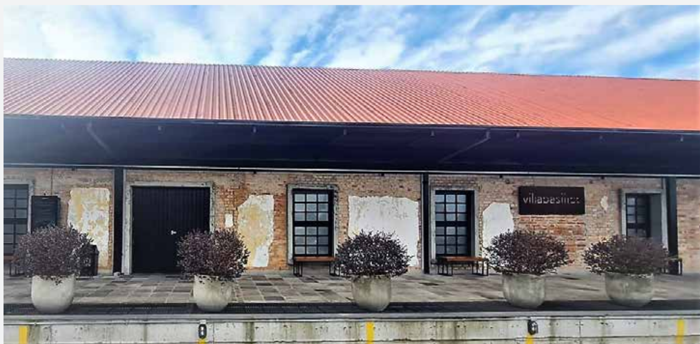
Villa Basilico recebe principal evento do SindiPetro