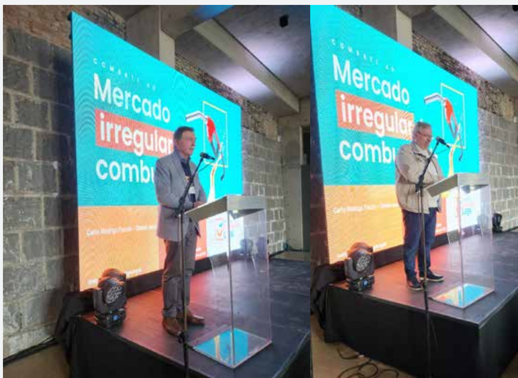
Prefeito de Caxias do Sul, Adiló Didomenico e presidente do Sindipetro, Vilson Pioner, deram as boas-vindas.

Advogados Associados. No mesmo espaço os visitantes puderam conversar com a contabilidade do Sindipetro. Outros benefícios disponibilizados na feira foram de 40 inscrições gratuitas para os treinamentos da Comissão Interna de Prevenção de Acidentes e de Marketing Digital.