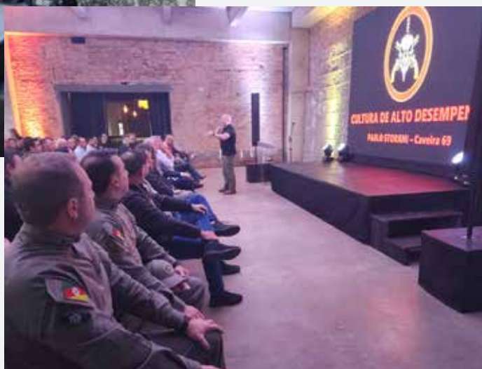
Storani abordou sobre excelência