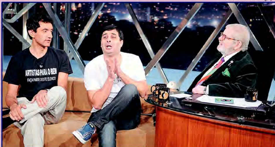
Dupla de humoristas participou do Programa do Jô