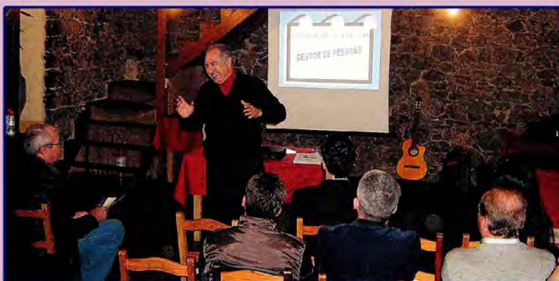
Palestra integra as atividades do projeto Sindicato Itinerante