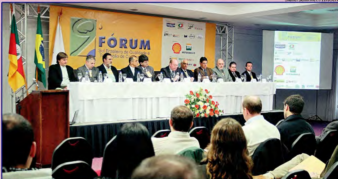
Um dos temas abordados pelos palestrantes do evento realizado em Bento Gonçalves foi o biodiesel