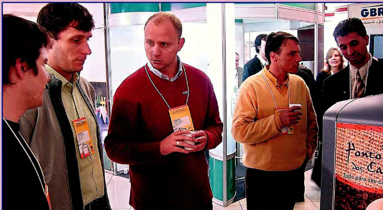
Revendedores conferiram última edição da Expopetro em 2008 - ano passado não houve devido a gripe A