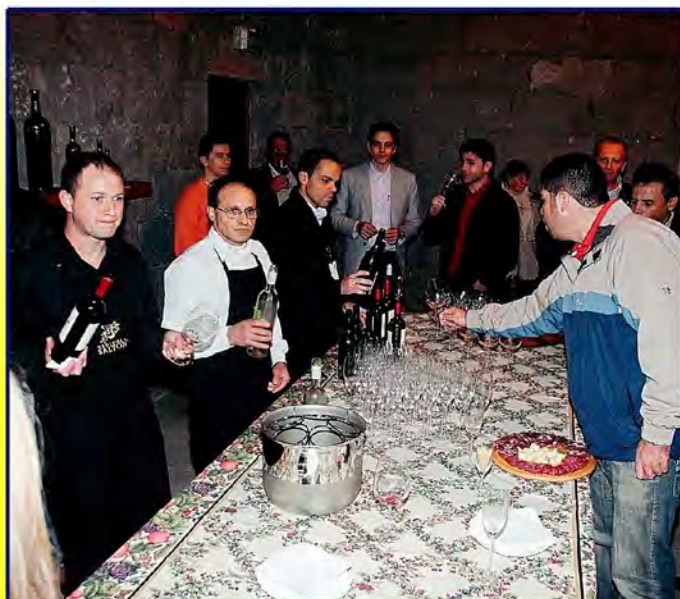
Participantes puderam saborear as delícias da Serra

Além de discussões e debates sobre os problemas do setor de combustíveis, o 9º Fórum teve momentos de descontração e de lazer. Um deles ocorreu ao final da primeira etapa de atividades, com um jantar na Vinícola Salton, em Bento Gonçalves.