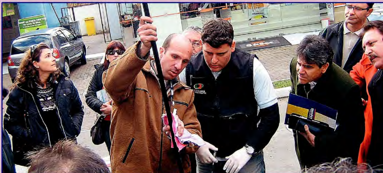
Treinamento envolveu 60 servidores da região da Serra