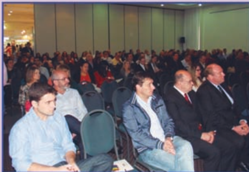
Público total do evento ultrapassou as 400 pessoas

Realizada no Intercity Premium Caxias do Sul, a feira contou com 25 patrocinadores, 14 a mais do que na anterior.