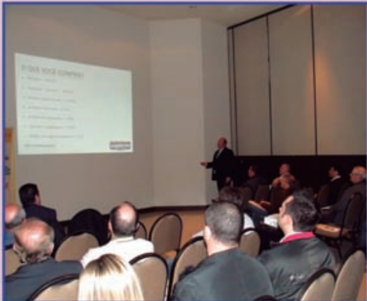
Último encontro ocorreu em Gramado

Mais informações sobre o Sindicato Itinerante podem ser obtidas pelo e-mail secretaria@sindipetroserra.com.br ou pelo telefone (54) 3222.0888.