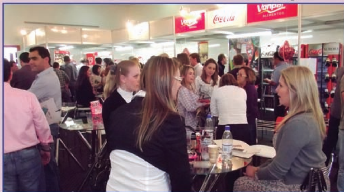
Evento realizado no hotel Intercity, em Caxias do Sul, reuniu mais de 400 pessoas e apresentou as principais tendências do mercado