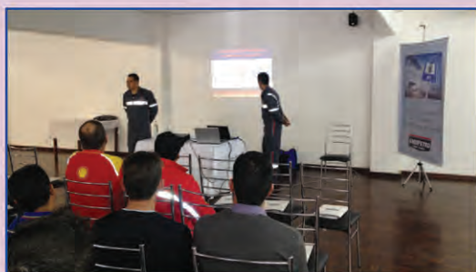
Alunos receberam instruções sobre segurança

O Sindipetro Serra Gaúcha promoveu mais duas edições do Treinamento de Prevenção e Combate a Incêndio (TPCI). O curso obrigatório teve aulas teóricas e práticas e foi realizado em agosto, na Câmara de Indústria, Comércio e Serviços (CIC)