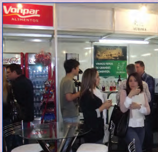
Espaço quase dobrou da edição passada