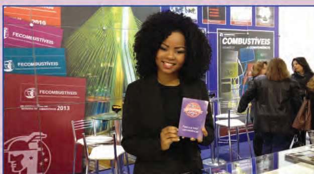
Sindipetro aproveitou feira em São Paulo para divulgar Expo Conveniências

pequeno shopping. Na estrutura estão reunidas 13 lojas - de restaurantes até uma sapataria. Juntas atendem mais de 4,5 mil pessoas nos finais de semana. O posto dispõe de uma lavagem diferenciada que reaproveita a água e de uma grande área de estacionamento.