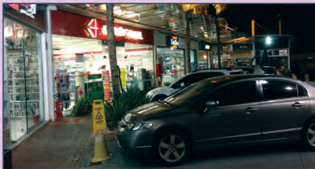
Grupo visitou posto Stop Center, que conta com 13 lojas

Depois de conferir as palestras e as novidades da feira, a comitiva passou por dois postos de São Paulo (SP). No primeiro deles, o Stop Center, na Avenida Pompéia, conheceram uma realidade diferente. Lá, a revenda concentra estabelecimentos comerciais diversos, como um