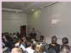
Sindipetro cria exposição em 2011