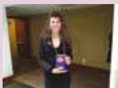
Convite é entregue na Expopetro em Gramado