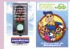
Sindicato elabora a revista Consciência Ecológica no Trânsito