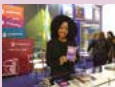
Feira é divulgada na Expopostos (SP)