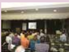
Contabilidade e meio ambiente foram pauta em 2011