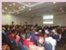
Edição de 2013 reúne 620 pessoas