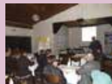
Todos os anos projeto Sindicato Itinerante reúne empresários e diretores do Sindipetro - Vacaria - 2010