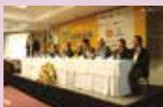
Entidade organiza pela segunda vez o fórum sobre qualidade e tributação em Bento