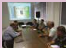
Diretoria conversa com comando do 12º BPM sobre assaltos