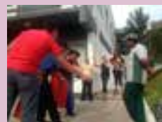
Enesul é contratada para implantar a NR-20 em postos associados