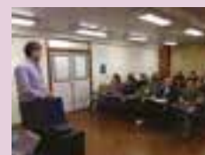
Engenheiro trata dos novos combustíveis que chegaram ao mercado