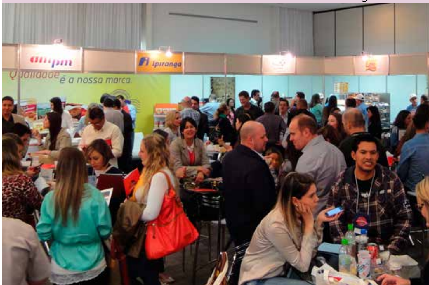
Expo Conveniências foi criada na atual gestão do Sindipetro Serra Gaúcha.