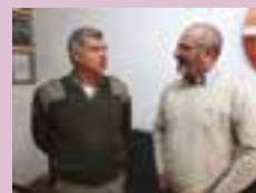
Representantes do sindicato visitam comando do CRPO