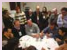
Empresários e gerentes participam de curso intensivo