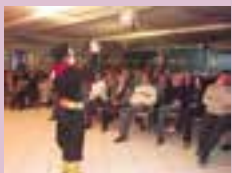
Jair Kobe, o Guri de Uruguai, faz a festa em 2012