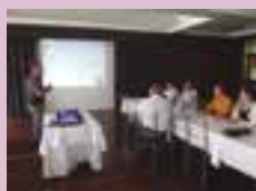
Oficiais da BM apresentaram estatísticas de roubos