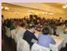
Sindicato traz especialista para falar sobre problemas no diesel