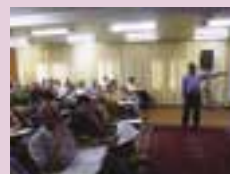
Sindicato traz especialista para falar da área financeira