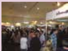
Em 2012 espaço é ampliado