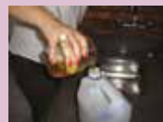
Entidade realiza campanha Coleta de Óleo de Cozinha