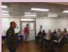
BM e Sindipetro promoveram curso com dicas de prevenção