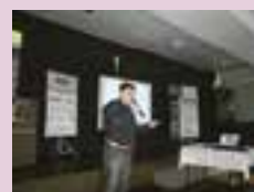
Contadores recebem informações das novidades do setor