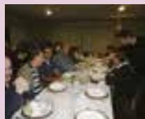
Sindipetro organiza encontro com ANP em 2011