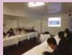
Empresários participam de capacitação da NR-20