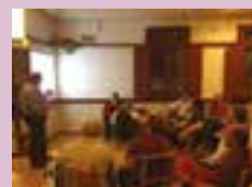
Diretoria percorre e leva informações nas cinco regiões de abrangência - Bento Gonçalves - 2013