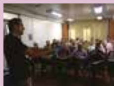
Técnicos esclarecem dúvidas relacionadas à norma