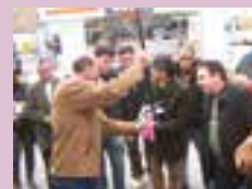
Sindipetro e CSQC treinam policiais civis contra adulteração e sonegação