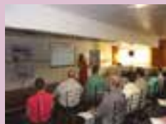
Entidade traz empresas especializadas para falar da norma