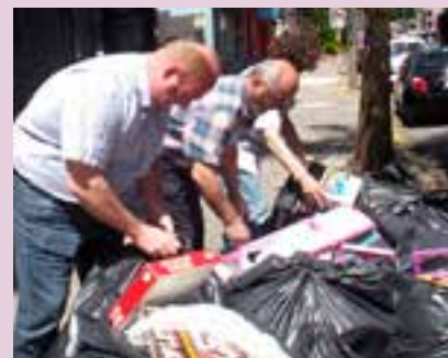
Doações foram entregues na FAS

Nesta sétima edição a campanha também premiou os funcionários de postos que