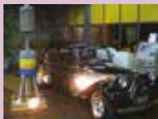
Festa conta com carros antigo e atual, além de bomba de combustíveis - 2010