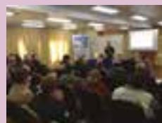
Sindipetro realiza workshop com três especialistas