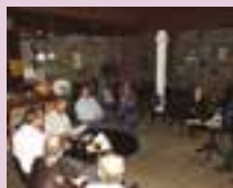
Sindicato promove conversa com integrantes da ANP