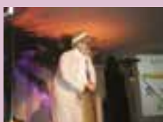
Show de humor com o grupo Primeiro as Damas - 2011