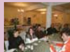
São levadas informações atualizadas para toda a categoria - Lagoa Vermelha - 2011