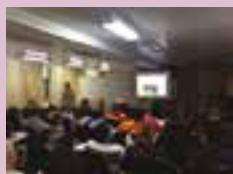
Curso prático e teórico forma mais de 2 mil pessoas