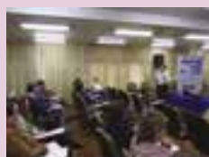
Sucessão familiar é tema de encontro entre revendedores