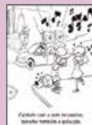
Escolas da região usam revista para atividades em sala